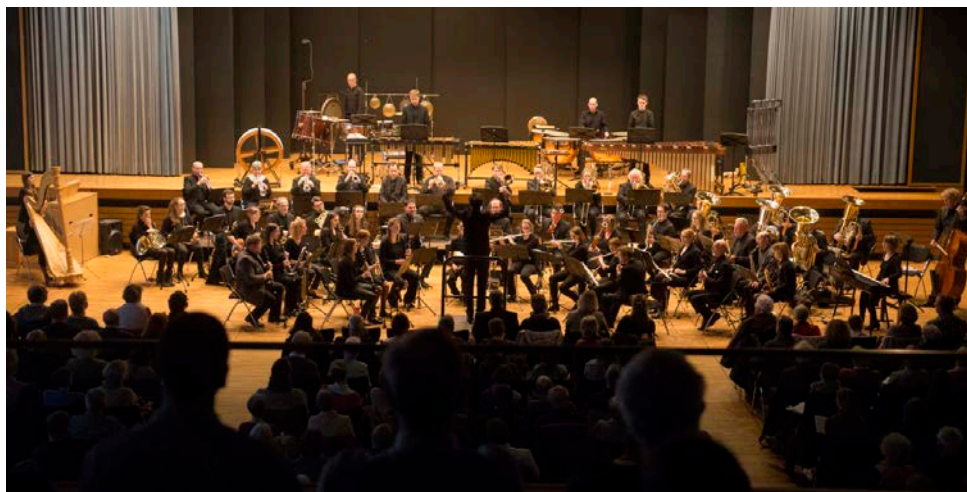
Die Bläserphilharmonie Osnabrück im Jahre 2016 bei ihrem Projekt »... und Welt und Traum.«

Die Bläserphilharmonie Osnabrück blickt bereits auf mehrere ereignisreiche Jahre zurück, zu dessen musikalischen Höhepunkten sicherlich, neben vielen erfolgreichen Konzertprojekten, auch die Gestaltung der Bühnenmusiken zu den Opernproduktionen »Aida« (2011), »L'Elisier d'Amore« (2013), »La Boheme« (2013) und »Rigoletto« (2017) des Theaters Osnabrück zählen. Zudem gastierte sie im Rahmen der Osnabrücker Städtepartnerschaft 2014 im niederländischen Haarlem und überzeugte in der dortigen Philharmonie gemeinsam mit etwa 150 Choristen mit